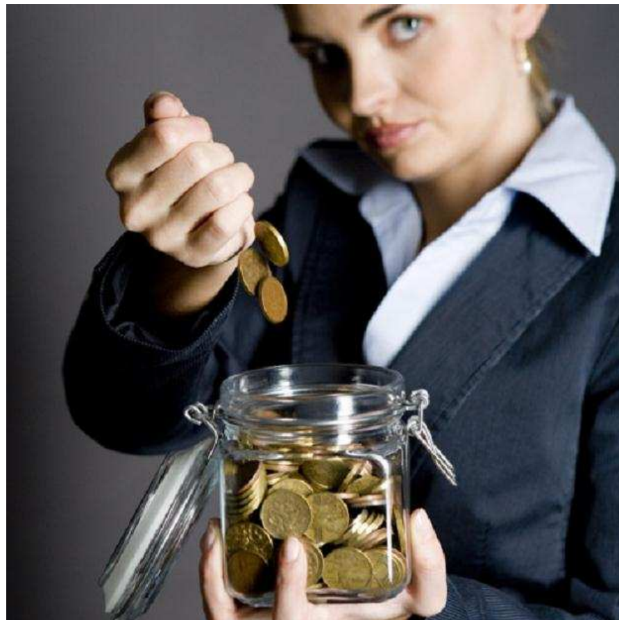
Rezygnacja ze złotówki na rzecz eurowaluty przyniesie pozytywne zmiany

Polski small biznes wciąż nie ma wielkich nadziei na poprawę sytuacji gospodarczej kraju w najbliższych trzech miesiącach. Również negatywnie oceniana jest aktualna kondycja ekonomiczna Polski - wynika z najnowszej edycji badania Sektora MŚP prowadzonego co kwartał przez wrocławski Instytut KerallaResearch.