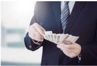
Co piąta firma nie dostaje kredytu

Firmy poszukujące finansowania bankowego na bieżącą działalność i inwestycje muszą być gotowe na trudności. Tego przynajmniej dowodzi badanie zrealizowane przez Instytut Keralla dla firmy faktoringowej NFG. Z zebranych danych wynika, że odmowy uzyskania kredytu doświadcza dziś średnio co 5. przedsiębiorca. To dość spory odsetek, zważywszy fakt, że przed trzema laty z kwitkiem odsyłano co 7. Ratunkiem dla firmy, której wniosek odrzucono, może być faktoring.