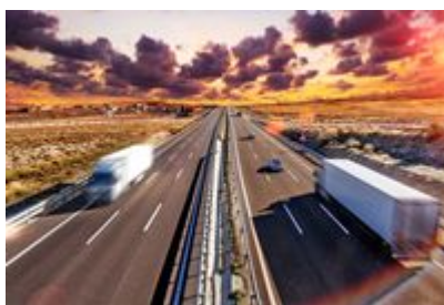
Przybywa kłopotów w polskiej branży TSL

Więcej upadłości i zmiany, które tylko pogłębiają istniejące już problemy. Tak w dużym uproszczeniu można podsumować obecną sytuację branży TSL. Dodatkowo spraw nie ułatwia narastający deficyt pracowników. To niektóre wnioski, które płyną z opracowanego przez Instytut Keralla Research badania „Finanse, inwestycje, trendy branży transportowej w 2019 roku”.