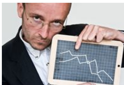
Spadek nastrojów MŚP

Jest gorzej. Przynajmniej jeżeli chodzi o badane przez Instytut Keralla Research nastroje towarzyszące przedstawicielom sektora małych i średnich przedsiębiorstw. Najnowszy odczyt wskaźnika KERNA pokazał wartość o 3,92 pkt. niższą niż przed kwartałem. Negatywnej zmianie uległa również skłonność do inwestowania - obrazujący ją indeks ZAIR osiągnął poziom 62,47 pkt. na minusie, co względem poprzedniego notowania również oznacza spadek.