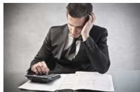
Opóźnione płatności to w Polsce norma