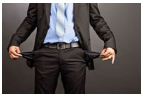
Ponad 37 mld zł zaległości firm na koniec 2021 roku

W 2021 roku zaległości firm urosły o 11 proc., osiągając na koniec grudnia wartość 37,32 mld zł - wynika z danych Rejestru Dłużników BIG InfoMonitor i bazy informacji kredytowych BIK.