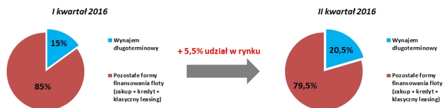
Udział wynajmu długoterminowego w całkowitej sprzedaży aut osobowych do firm w Polsce

Rosnąca popularność wynajmu długoterminowego jest również widoczna na przykładzie zwiększającego się udziału aut kupowanych na potrzeby tej usługi w całkowitej sprzedaży nowych samochodów do firm w Polsce. Udział ten zwiększył się w II kwartale 2016r. aż o ponad 5% w porównaniu z pierwszymi 3 miesiącami roku – z 15% do 20,5%.